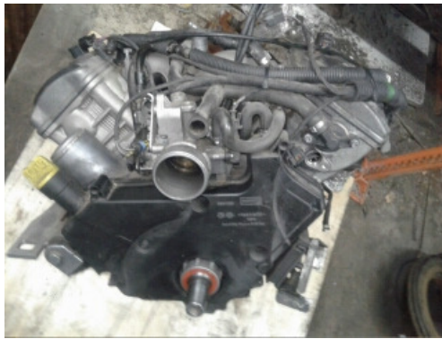
20160208_210534.jpg (85 KB | )